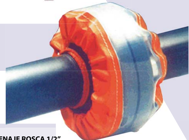
SIN DRENAJE ROSCA 1/2" WITHOUT DRAIN CONNECTION THREADED 1/2"